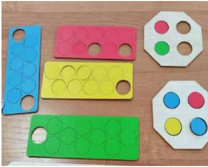
Фото 8. «Цветные доски»