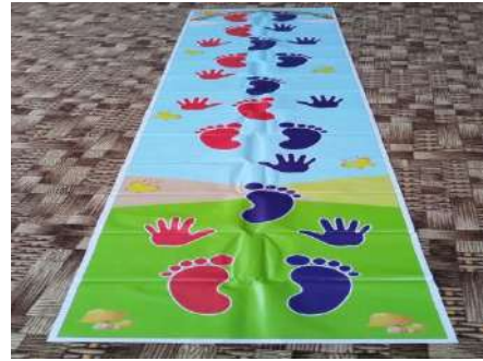
Фото 9. Нейродорожка