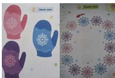
Фото 5. Упражнение «Варежки и снежинки»