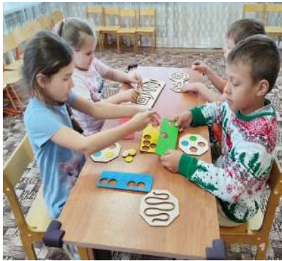
Дети работают с нейротренажёрами