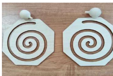
Фото 6. «Лабиринты»