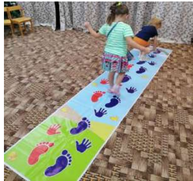
Дети на Нейродорожке