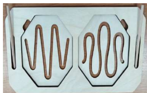
Фото 7. «Лабиринты»