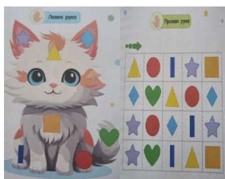
Фото 3. Упражнение «Котёнок»