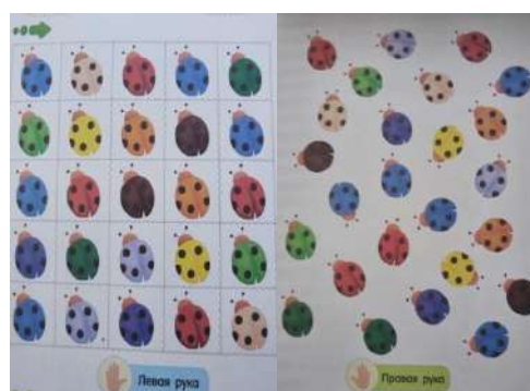
Фото 4. Упражнение «Божьи коровки»