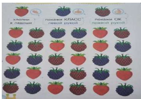
Фото 1. Упражнение «Ягоды»