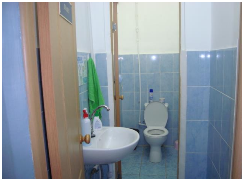
Приложение 5 № 11. Туалетная комната для взрослых