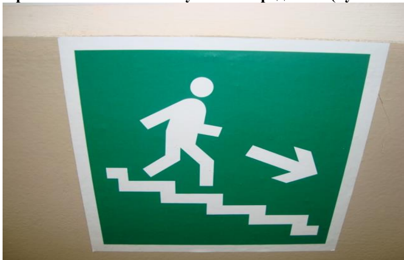
Приложение 6 № 14 Визуальные средства (пути эвакуации)