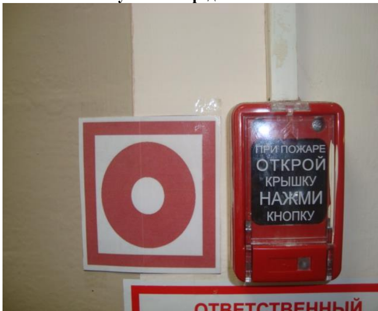
№ 16 Визуальные средства