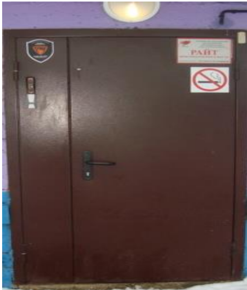
Приложение 2. № 3. Дверь входная