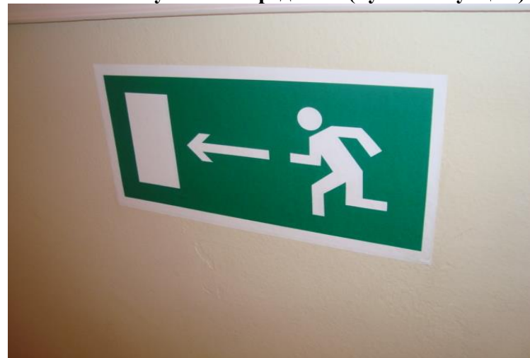
№ 15 Визуальные средства (пути эвакуации)